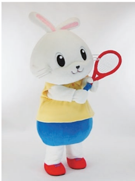
ソフトテニス マスコットキャラクター「そふていー」